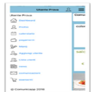
Menu di navigazione