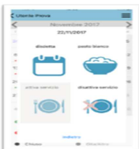
Sceita disdetta, pasto in bianco, Attivazione/disattivazione servizio