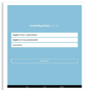
Login e scelta comune